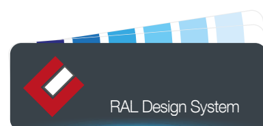
Mazzetta FARBEX INTERIOR DESIGN